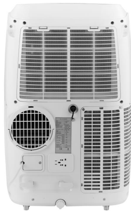
Abluftschlauchanschluss 150 mm Schlauchdurchmesser