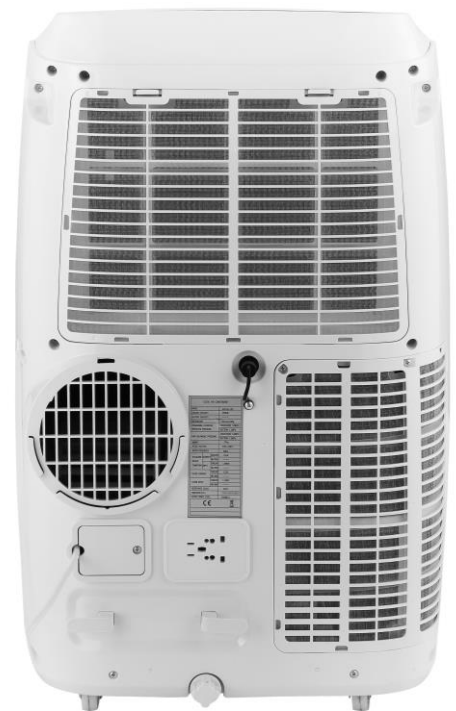
Abluftschlauchanschluss 150 mm Schlauchdurchmesser