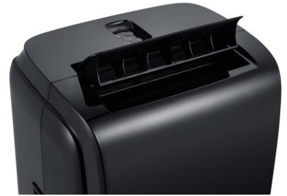
Luftauslass und Fernbedienungsablage