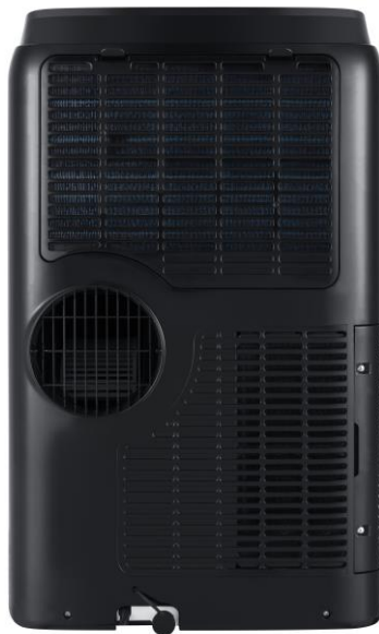
Abluftschlauchanschluss 150 mm Schlauchdurchmesser