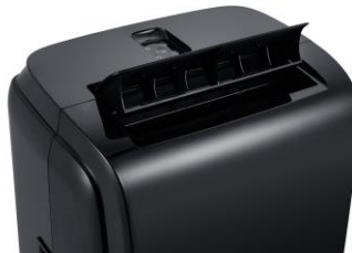
Luftauslass und Fernbedienungsablage