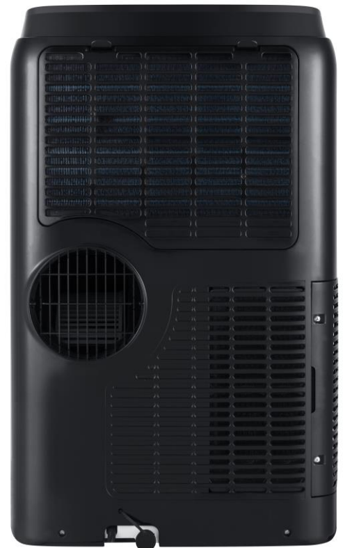
Abluftschlauch 150 mm Schlauchdurchmesser