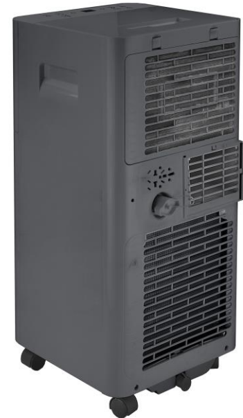
Abluftschlauchanschluss 150 mm Schlauchdurchmesser