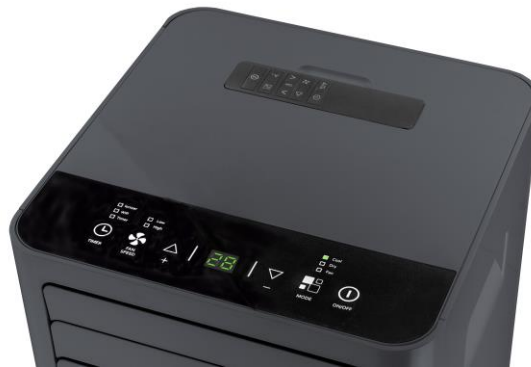
Einlagefach für die Fernbedienung