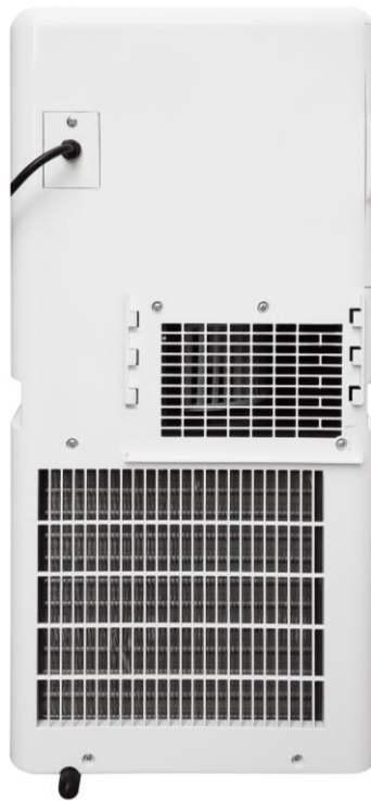
Kondenswasser Abfluss Pfropfen