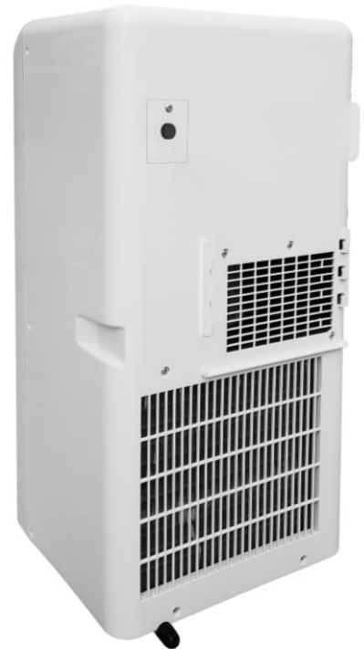
Abluftschlauchanschluss 150 mm Schlauchdurchmesser