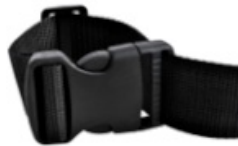
Klamra szybkiego zwalniania do...