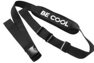
Widok z ukosa