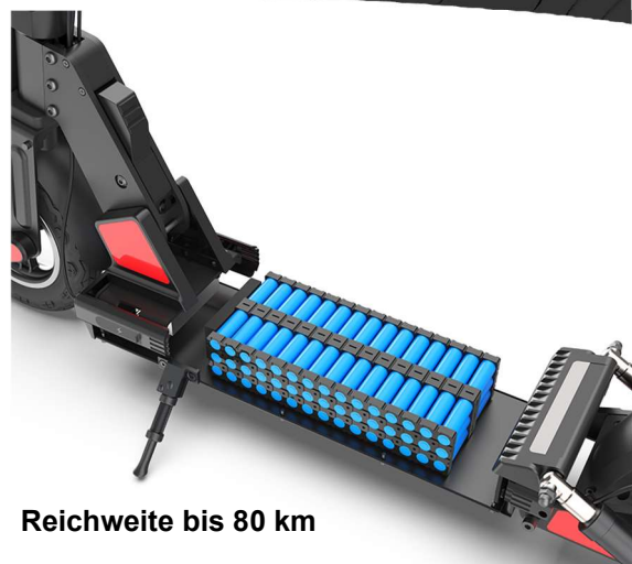
Reichweite bis 80 km