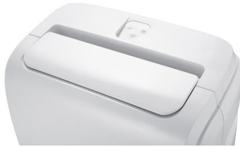
Luftauslass und Fernbedienungsablage

Neben der Abkühlung der Luft unterscheidet sich das Klimagerät von herkömmlichen Ventilatoren dadurch, dass die abgekühlte Luft auch entfeuchtet und gereinigt wird. Dadurch verbessert sich das Raumklima um zwei weitere, für das Wohlbefinden relevante Parameter.