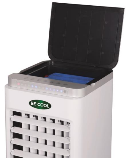
Wassertank von oben zu befüllen