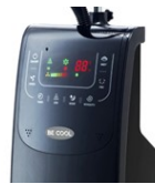
Anzeige und Bedienfeld