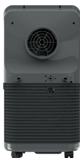
Widok z tyłu