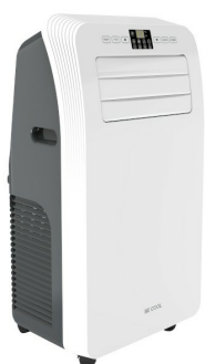
Widok z ukosa