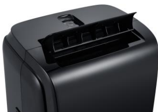
Luftauslass und Fernbedienungsablage