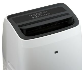
Widok z góry 2