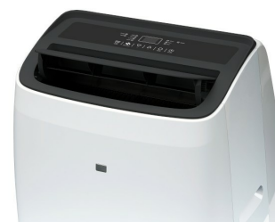
Widok z góry 1