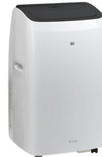
Widok z ukosa 2