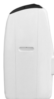
Widok z boku 2