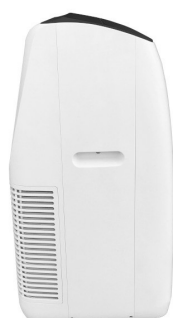
Widok z boku 1