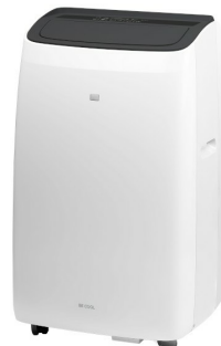
Widok z ukosa 1