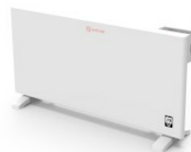
Schrägansicht mit Bedienfeld