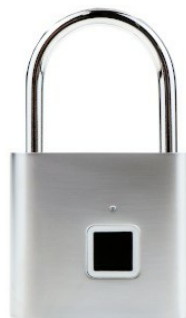
Widok z przodu w trybie gotowości