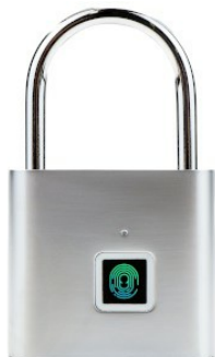
Widok z przodu