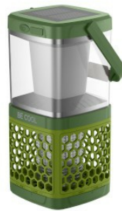
Widok ukośny #2