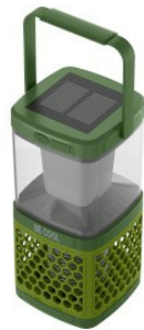
Widok z ukosa z góry - panel słoneczny