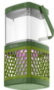
Widok z ukosa na spód - włączony