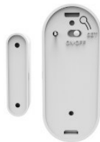
Widok z tyłu