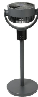
Frontansicht - Ventilatorkopf nach oben