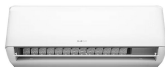
Frontansicht - Klappe geöffnet