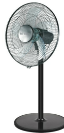
Oblique view small