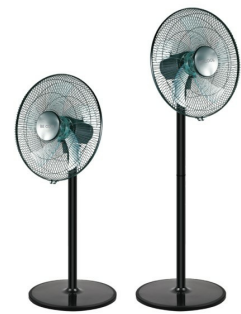
Oblique view small/large